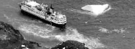
南极海域冰川融化。

他说，除最高150年监禁外，麦道夫将面临强制赔偿受害者、没收最多1700亿美元非法收益和罚金。