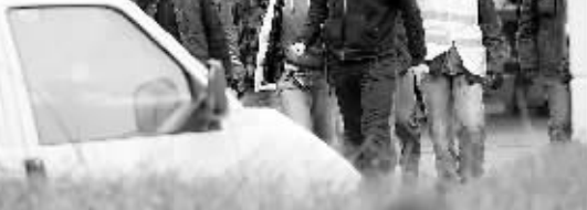
德国警察和救援人员在发生枪击案的中学门口忙碌。

他说，除最高150年监禁外，麦道夫将面临强制赔偿受害者、没收最多1700亿美元非法收益和罚金。