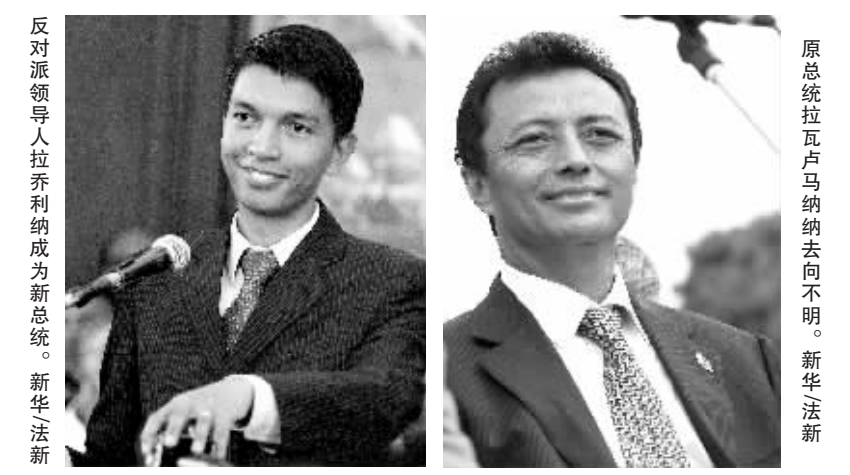
反对派领导人拉乔利纳成为新总统。