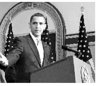
奥巴马伸手要巨额预算。