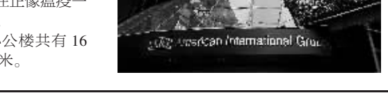
新华社专电 AIG发言人马克·赫尔18日说,AIG计划出售位于纽约曼哈顿的总部大楼(见右图)和附近另一幢办公楼。