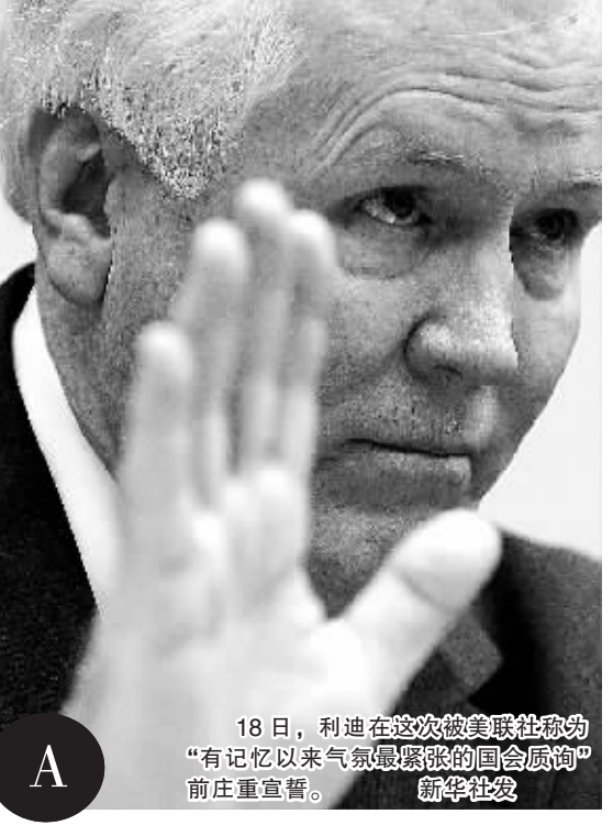
18日,利迪在这次被美联社称为“有记忆以来气氛最紧张的国会质询”前庄重宣誓。

据新华社华盛顿3月18日电(记者刘洪胡)美国国际集团(AIG)首席执行官爱德华·利迪18日在国会作证时说,他知道外界对该公司发放高额奖金的愤怒,已要求员工退还部分奖金。