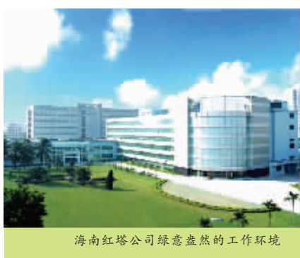
海南红塔公司绿意盎然的工作环境