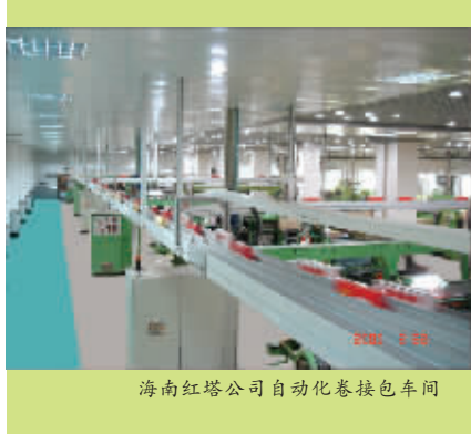
海南红塔公司自动化卷接包车间