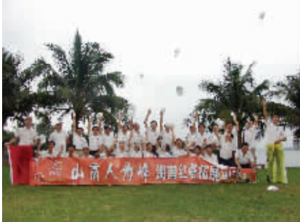
海南红塔公司管理团队拓展训练