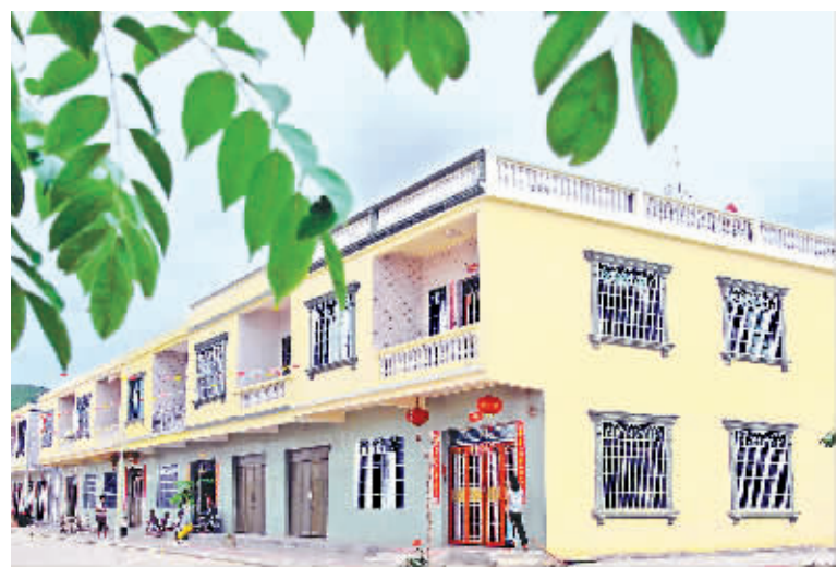
椰林镇拆迁的居民住上统一规划的小洋楼。

每天傍晚,陵水黎族自治县县城椰林镇的居民饭后都喜欢走向陵水河边,或沿着河的两岸散步闲谈,或在河边的简易健身场所活动开来,或在堤岸旁的草地上盘坐歇息;待到天色见黑,华灯初上,椰林大桥和桃源大桥的灯光倒映在水面时,夜景越发美丽起来。