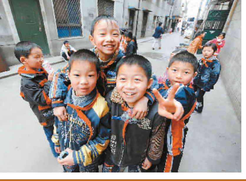
孩子们在小巷里活动。

在武汉市汉兴街新松里社区一栋五层的民房里，有一所专门接收农民工子女的凌智小学。这所小学创办于1999年，目前有400多个学生在此就读。办学10年来，小学历经多次搬迁，因为之前曾位于一个菜场楼顶，被称为“楼顶小学”。搬到目前所在的小楼后，学习与活动空间依旧狭小，唯一一块室外活动场地是小楼的楼顶。坚守了10年的凌智小学继续着自己“楼顶小学”的命运。