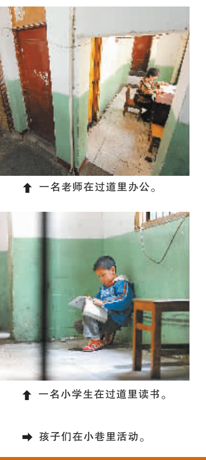
一名老师在过道里办公。

坚持实践第一、质量第一、群众满意第一，着力在深化理论武装、解决突出问题、营造有利于科学发展的政策制度环境、加强和改进作风等四个方面下功夫，增城市学习实践活动取得了明显成效，基本实现了“党员干部受教育、科学发展上水平、人民群众得实惠”的目标。一是科学发展观进一步深入人心。通过学习实践活动，广大干部群众对科学发展观的认识进一步深化，全市上下贯彻落实科学发展观的自觉性和坚定性进一步增强，形成了科学发展的思想共识。干部队伍的执行能力有了新提高，抢抓机遇、奋发有为、争创创优的意识不断增强。进一步坚定了把中央战略部署和省委、广州市委的战略决策，因地制宜变为增城科学发展具体举措的信心，进一步提升了科学决策的能力，形成了“人人想干事、人人争干事、人人能干事、人人干成事”的浓厚氛围。二是科学发展的“增城模式”进一步完善。在广泛吸纳社会各界的意见和建议的基础上，增城市初步形成了“以人为本、政府主