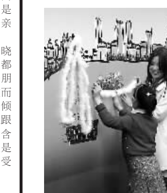
3月29日,上海“东方女儿节”在上海苏州河畔的长风生态园开幕。“东方女儿节”源于传统的农历三月三“上巳节”。