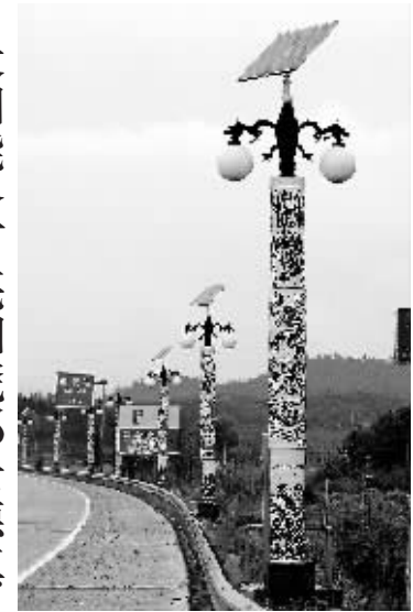
用陶瓷作为电线杆的太阳能路灯(3月29日摄)。日前,一批用陶瓷作为电线杆的太阳能路灯亮相都景德镇。这种太阳能路灯能根据光线强弱自动控制开关,即使在阴雨天,只要有光线,它就可以充电,不需要消耗电力和其他能量,既清洁、环保、节能、便于管理,又可美化亮化环境,为瓷都景德镇增添一道有地方特色的靓丽风景。

新华社长春3月29日专电(记者宗爽)为给市民创造良好的乘车环境,吉林省长春市公共交通集团巴士公司规定,周末两天为“司机乘客交流日”,要求公交车司机走出车厢走上站台,与乘客面对面交流。