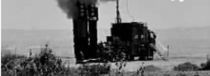
3月29日,印度在拉贾斯坦邦的发射基地成功试射“布拉莫斯”超音速巡航导弹。