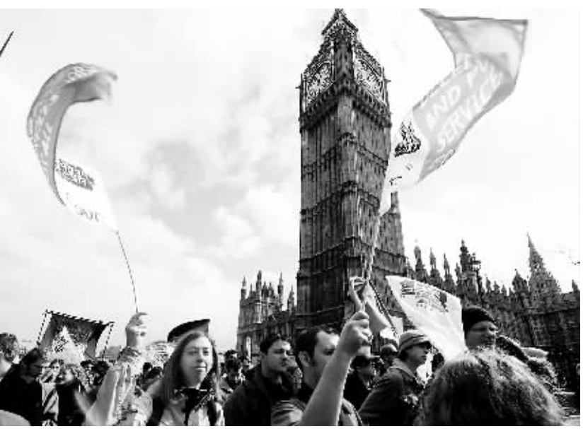
3月28日,在英国伦敦,游行队伍经过英议会大厦。