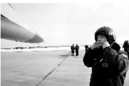
3月28日,俄罗斯总统梅德韦杰夫视察了库宾卡空军基地,并登上一架苏-34打击轰炸机,亲身体验了空中飞行。