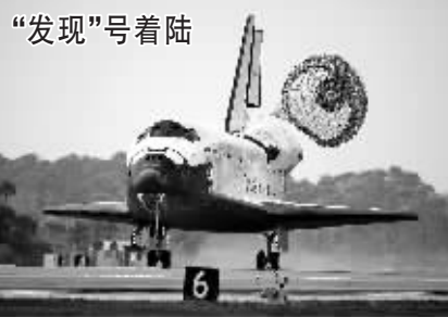
“发现”号着陆 美国东部时间3月28日15时14分,美国“发现”号航天飞机平安降落在佛罗里达州肯尼迪航天中心。