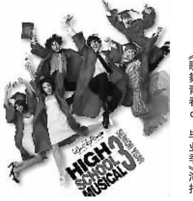
《歌舞青春3:毕业季》海报

据新华社洛杉矶3月28日电 美国著名儿童电视台尼克洛迪恩28日晚在洛杉矶举行第22届美国“儿童选择奖”颁奖典礼,所有奖项均由14岁以下儿童投票选出,《歌舞青春3:毕业季》获最受欢迎影片奖。 今年选票达到创纪录的9000万张,迪斯尼公司的校园喜剧片《歌舞青春3:毕业季》除当选最受欢迎影片外,该片女主角瓦妮莎·赫金斯还获评最受欢迎女演员。 最受欢迎动画片由《马达加斯加2:逃往非洲》获得,最受欢迎男演员颁给了威尔·史密斯,他去年主演的《全民超人汉考克》得到孩子们认可。动画片最佳配音奖由《功夫熊猫》中熊猫配音者杰克·布莱克获得。