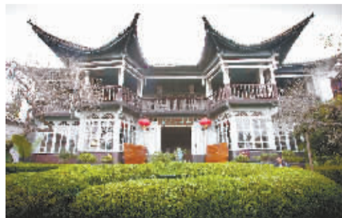
↑ 建筑风格中西合璧的和顺图书馆。