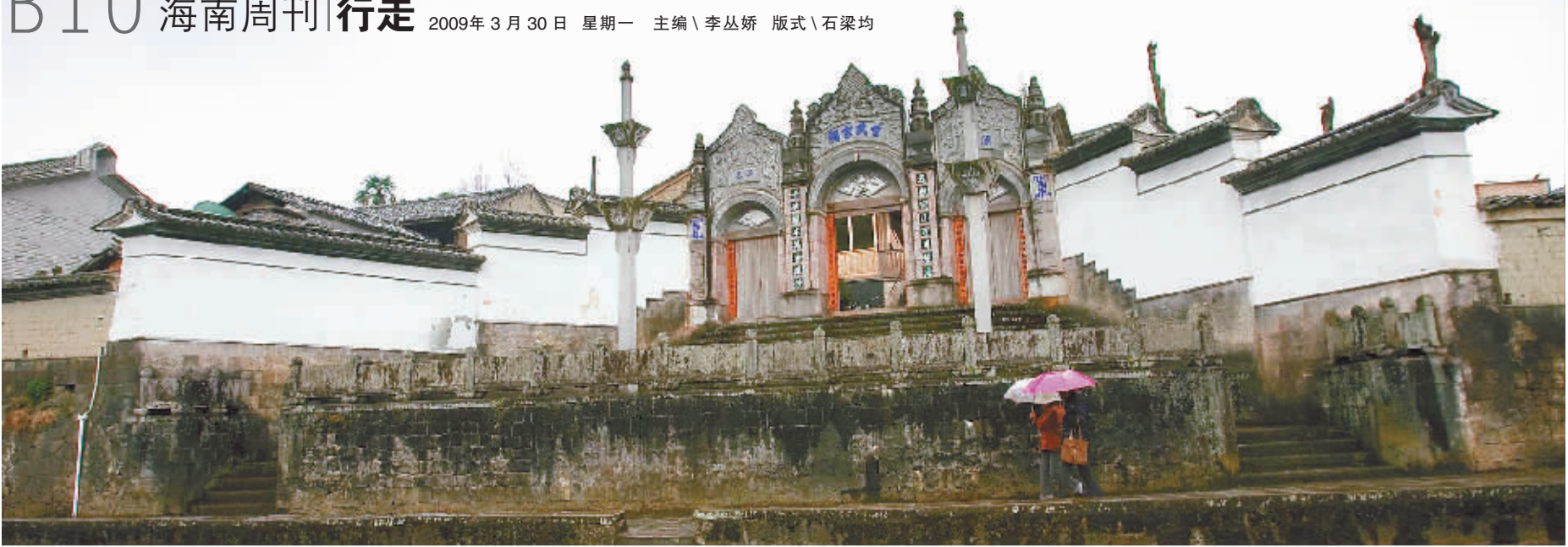
↑ 和顺乡古朴大气的寸氏宗祠。