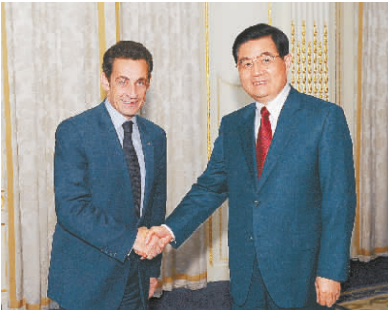
主席胡锦涛在伦敦会见法国总统萨科齐。