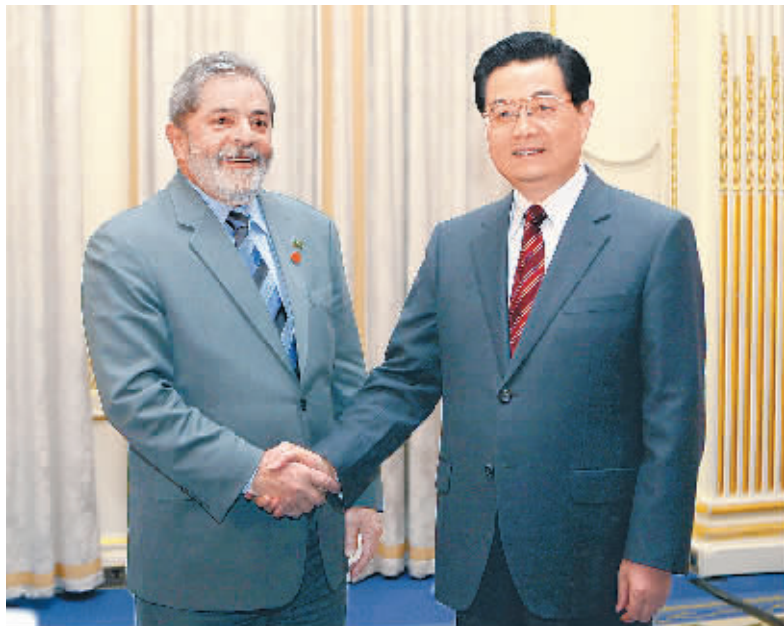
二次金融峰会期间会见巴西总统卢拉。