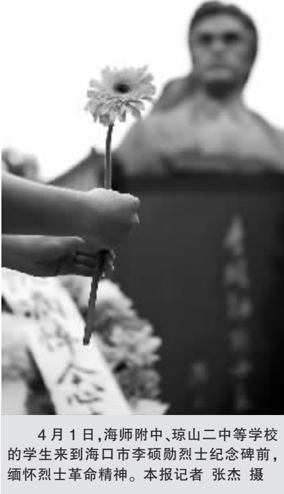
4月1日，海师附中、琼山中等学校的学生来到海口市李硕勋烈士纪念碑前，缅怀烈士革命精神。