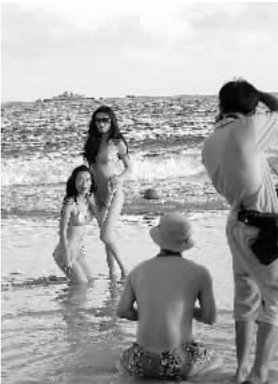
美丽三亚 时尚舞台

三亚市综合行政执法局有关负责人介绍,今年第一季度,三亚共开展拆迁行动28次,拆除违章建筑154栋,面积3.7万平方米;拆除简易棚76间,面积5125平方米。