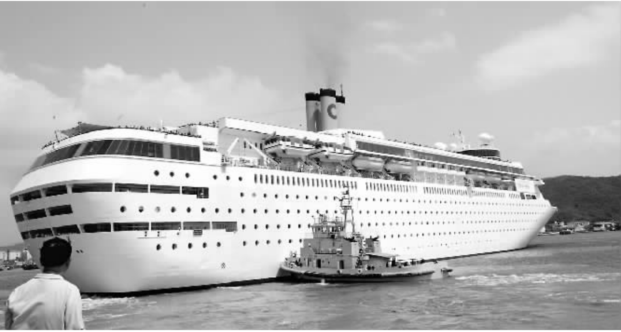
“歌诗达经典”号邮轮首航抵达三亚。