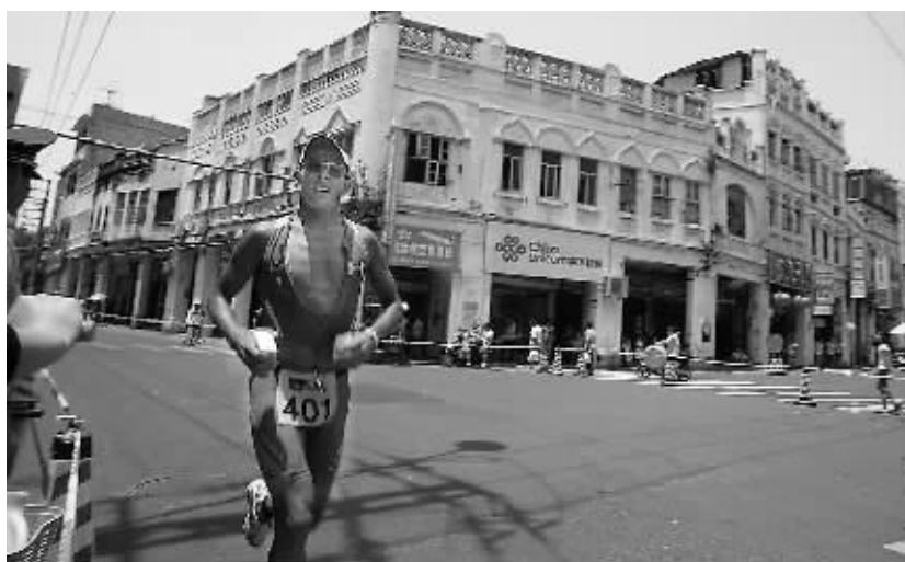
图为参赛选手穿越海口老城区时受到市民热烈欢迎。

本报海口4月19日讯（记者王黎刚、罗霞）2009年中国铁人赛今天下午在海口落幕，来自丹麦的铁人海宁·拉马斯用时8小时53分20秒率先抵达终点，摘得了男子组冠军。他的成绩比去年的冠军德国人萨巴特舒斯的成绩提高了18秒。女子冠军的是来自澳大利亚的选手夏洛特，她的成绩是9小时48分14秒。 本次比赛吸引了38个国家和地区的600多名铁人参赛，其中我省12人参加比赛。本次比赛路线途经海口南渡江畔、绕城高速、火山口、南洋骑楼历史文化街区等。2009中国铁人赛赛事分为两项内容，即中国铁人赛和中国70.3铁人赛两个项目的比赛。其中，中国铁人赛由3.8公里游泳、180公里自行车、42.195公里马拉松三个项目组成，设有男、女各12个年龄组和2个专业组。“中国70.3铁人赛”由