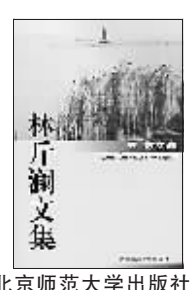
北京师范大学出版社

林斤澜先生,1923年生,浙江温州人。作品多为短篇小说,一般取材于农民或知识分子的现实生活,讲究构思立意,风格清新隽永,独树一帜。短篇小说《台湾姑娘》因在题材和写法上新颖独到,曾引起读者注意。1962年春,由老舍主持,北京市文联举行了三次“林斤澜创作座谈会”,专题讨论他作品的风格特色。改革开放初期写了一系列以浙江农村为背景的短篇小说,1987年结集为《矮凳桥风情》出版,一时为人传诵。这些作品语言凝练、含蓄,兼溶温州方言于其中。作者以浓缩的结构、突兀跌宕的情节,白描出一系列人物形象。林斤澜其他作品尚有《林斤澜小说选》(小说集,1980)、《石火》(小说集,1982)、《小说小史》(理论集,1985)、《蒲城飞花》(小说集,1987)以及一些报告文学等。