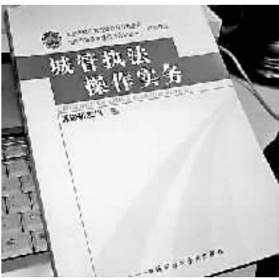
网上出现的“城管执法秘笈”。