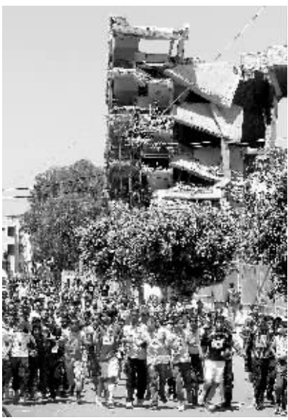
4月27日,在加沙城,包括残疾人在内的巴勒斯坦选手参加长跑比赛,以表达对巴勒斯坦内部和解对话的支持。