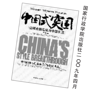
考个人职业生生涯的未来道路。相信在中国经济再造黄金30年的征程中,中国企业也将迎来新的发展机遇。”(王征彬)

有关专家表示:“《中国式突围》在金融巨变下参谋地方政府经济决策,导航企业生存与成长,不仅充满了积极的应对措施,更以饱满的信心鼓舞读者。为创业者指出了成功的捷径,也让每个人能更好地从宏观经济角度了解自己所在企业的发展,思