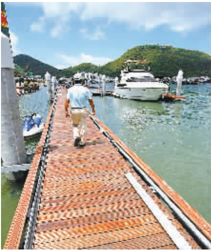
三亚游艇基地——鸿洲国际游艇码头一期建设的72个游艇泊位5月15日全部竣工。

三亚港边防派出所民警在调查取证的同时,多次到李某家中敦促其家属劝李某投案。在强大的思想攻势下,潜逃17天的李某昨天在家人的陪同下投案自首。在警方的调解下,当事双方达成共识,李某一次性赔偿林某医药费、误工费费用共计2万元。