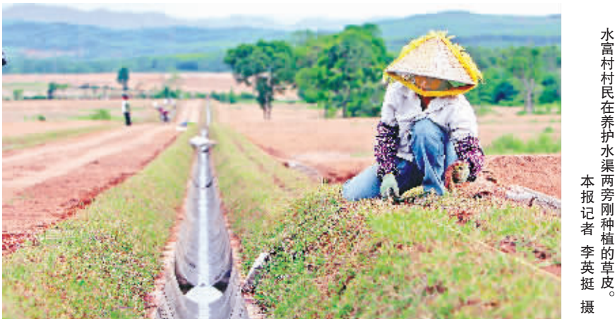
水富村村民在护水渠旁种植旱地。

今天,在昌江黎族自治县石碌镇水富村,村民正在忙着手中的活,没有在意当天在县城举行的书记大接访。