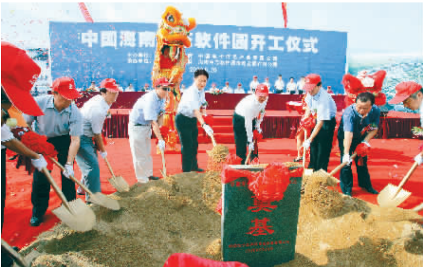
5月20日,海南生态软件园开工仪式在澄迈老城举行。

罗保铭出席开工仪式并下达开工令 省政府将投入 1 亿元工业发展资金支持园区基础设施建设