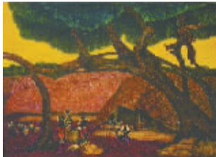
↑ 我省画家王锐水彩作品《春声》获第十届全国美展优秀奖,中国美术馆收藏。此幅作品采用写实带装饰的手法,将整个画面笼罩在一种暖色调中,画面中有很强的黑白对比和色彩和谐运用。