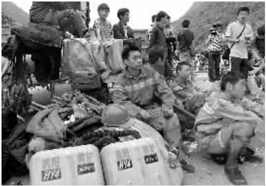
↑5月30日,矿井救援队的队员正在井口等待新的下井搜救命令。

发生事故的同华煤矿为重庆市属国有企业松藻矿务局下属企业,是一个有着50多年开采历史的老矿,设计年产能30万吨原煤,现实际已扩能到年产60万吨。