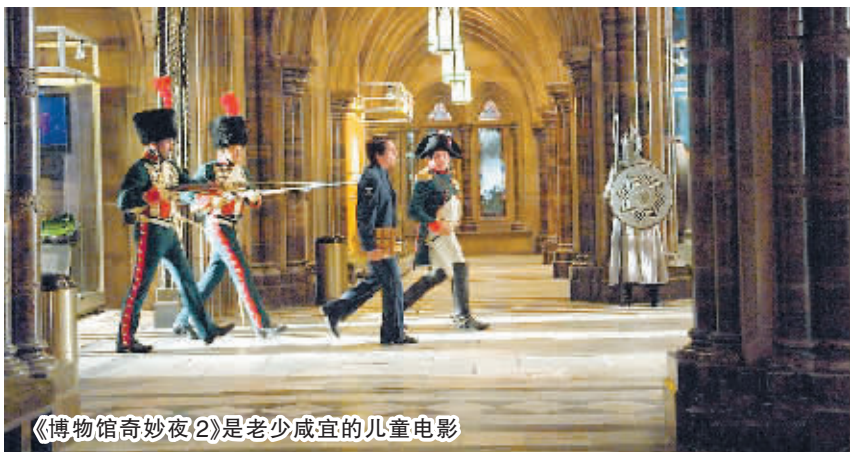
《博物馆奇妙夜2》是老少咸宜的儿童电影

片,主要是因为国内儿童影片的片源不足,而国外的儿童大片一般都会将它的档期安排在暑期黄金档,注重的是票房,因为那样的排映档期更长,会有更多的票房。《欢乐公主》导演陈刚说,发行商对儿童电影不够重视,也使儿童片宣传、发行的投入和其他影片不能同日而语。儿童片创作观念需要调整,它的市场运作观念同样需要改变。高军认为,从一定意义上说,儿童电影的市场运作观念比其创作观念的改变,更重要更急切。