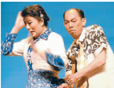
图为《香魂女》剧照

由朱延平执导,周杰伦、林志玲主演的古装寻宝题材影片《刺陵》即将拍摄完成。该片档期已经确定,周董这次将携手林志玲在12月中旬与拥有八大影帝级人马的陈可辛大片《十月围城》正面对撞。