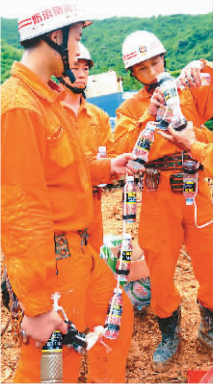
消防战士为被困人员准备饮用水。