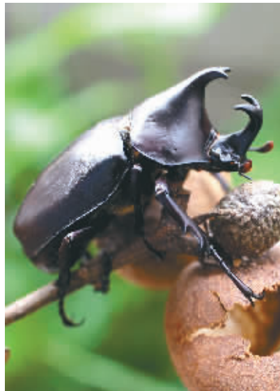
憨态可掬的犀金龟。