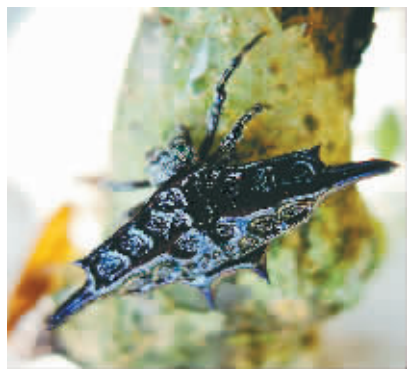
长有菱形身体的棘腹蛛。