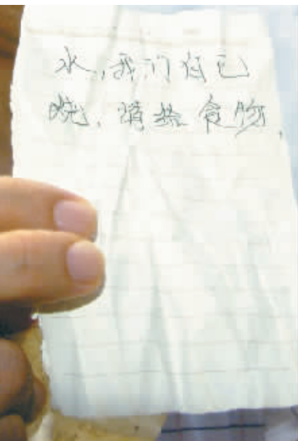
被困工人通过通道送上的纸条。

8名工人被困! 三亚市绕城高速公路迎宾隧道塌方事故现场,救援行动争分夺秒地进行着。