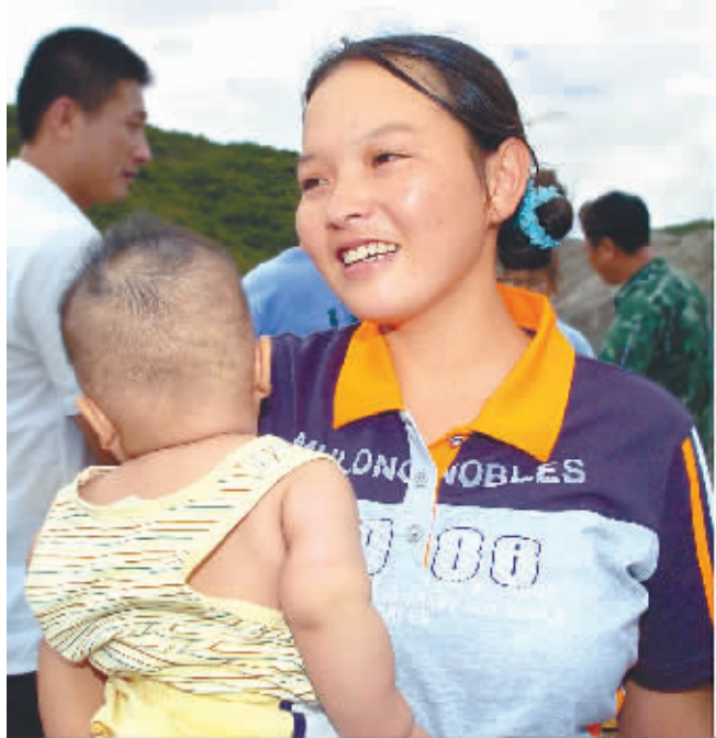
左图:6月6日,字国花在和被困在塌方隧道内的丈夫通话后,终于露出笑容。