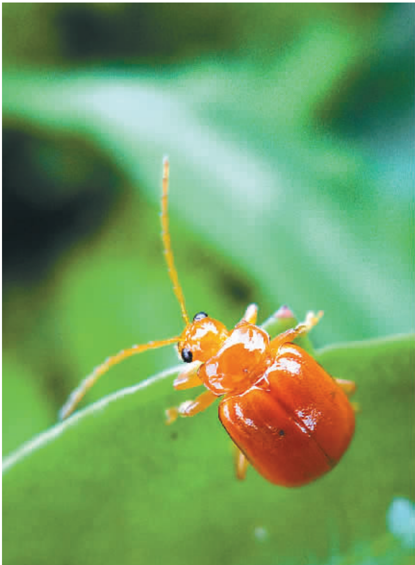
晶莹剔透的金黄色叶甲。