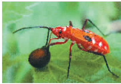
一只幼体红蜂正在就餐。

害虫类920多种。海南日报记者耗费近1年时间拍摄了大量昆虫图片,展现了多姿多彩的海南昆虫世界。(文\图 本报记者 苏晓杰)