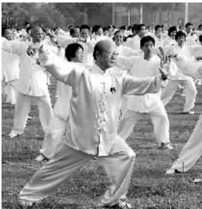
6月11日,临高县举行千人太极拳演练展示和观摩表演活动。

据介绍,临高目前有57个老年人体育协会。今年9月份开始,临高县老体协将深入各中小学推广太极拳,结合太极拳虚实、动静、开合、刚柔相济的特点,向广大师生传播健康、保健意识。