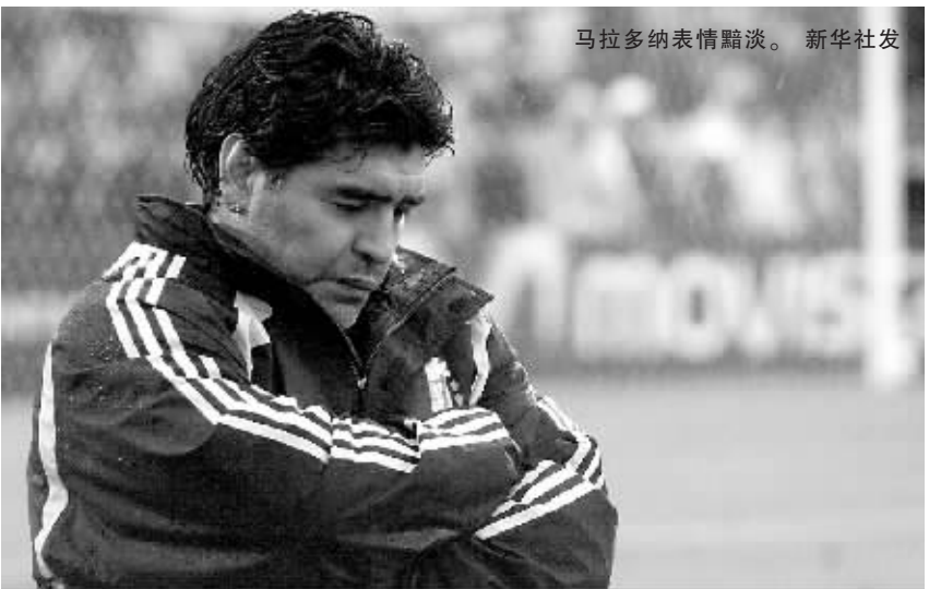
马拉多纳表情黯淡。

取”，因为在上半场令人难以置信地浪费了好进球的机会。所以主教练马拉多纳在比赛结束后高声喊冤，其教一点都纳在马拉多纳在去年担任阿根廷国家队主教练后，带领阿根廷队参加了世界杯预选赛四场比赛，战绩为两胜两负。考虑到对