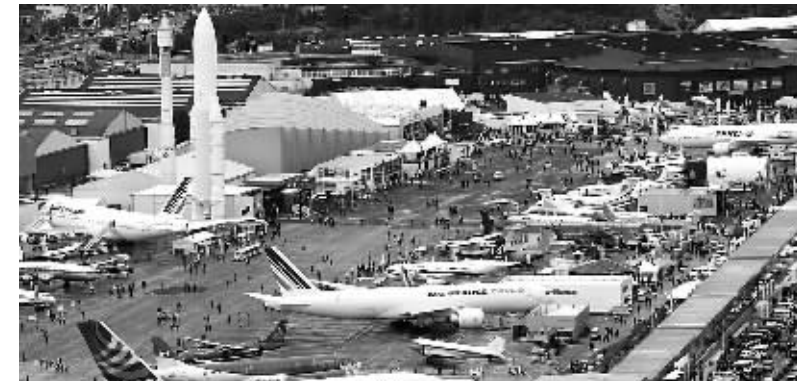
第48届巴黎国际航空展在法国首都巴黎北郊布尔歇国际展览中心开幕。

第48届巴黎国际航空展15日在世界经济不景气和法国航空公司客机事故阴影笼罩下开幕。 欧洲空中客车公司和美国波音公司作为全球两大飞机制造商首日销售遇冷,其中波音公司颗粒无收。 波音首日零订单 波音公司未能给观众和业界带来惊喜,下一代主打产品波音787“梦想”客机没有在展会上露面。 波音本打算去年上半年交付首批“梦想”客机,但交货日期一推再推,订户们至今未能“美梦成真”。 美联社报道,今年年初以来,波音收到73架民用“订单”,同时有66架订单被取消。 波音民用飞机部门总裁兼首席执行官斯科特·卡森15日说,波音787“梦想”客机“完全准备好”将会首先,公司会全力以赴在接下来两周内实现飞机上天。