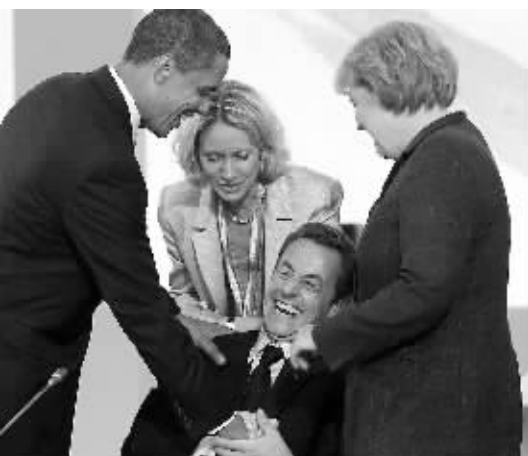
美国总统奥巴马(左一)、法国总统萨科齐(右二)和德国总理默克尔(右一)在八国集团首脑会议上交流。