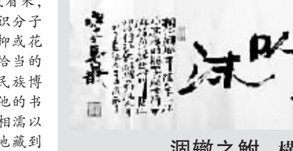
涸辙之鲋 艾黎明作