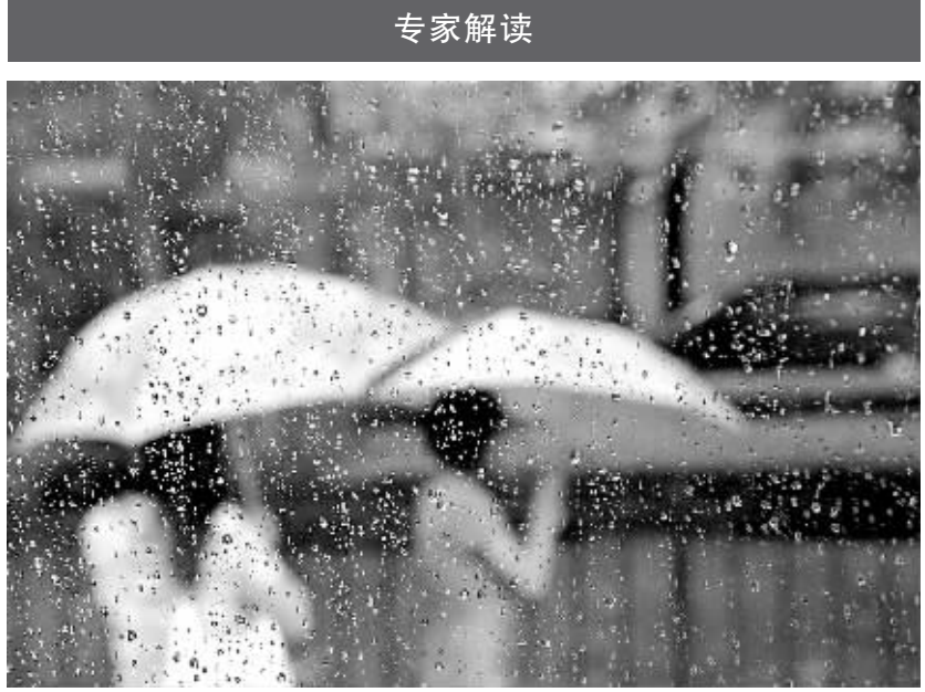
7月17日,北京迎来今年最大的一场区域性降雨,已经进入“伏”天的京城当日最高气温只有25摄氏度,京城民众尽享清凉。

专家解读 入夏以来,全国天气经常呈现出水旱相加的复杂态势。中央气象台17日10时同时发布暴雨预报和高温橙色警报,南方的高温仍将继续,而北方大部遭遇了一场强降雨。今年我国天气形势为何如此复杂?气象部门如何做好预测服务?中国气象局国家气候中心的专家17日就此接受了新华社记者采访。 长江中下游伏旱苗头显现 热!热!热!入夏以来,我国长江流域及江南地区,特别是湖北、湖南、江西、江苏、安徽、重庆等地连续出现高温晴热天气,让当地居民叫苦不迭。 据气象部门预测,17日“火炉”重庆以及江苏等地最高气温将达到40摄氏度;上海市17日上午气温快速上升,气象部门2小时内连发预警,将高温黄色预警升至橙色预警信号;安徽芜湖一地的最高气温已经突破了当地有气象记录以来的历史极值。 中国气象局国家气候中心高级工程师叶殿秀表示,从7月8日起一直持续至今的高温天气过程已经是今年入夏以来我国南方出现的第二次较大范围的高温天气。 她分析认为与发生在6月18日至21日的高温天气一样,造成此次南方高温盘踞的主要因素是今年该地区副热带高压位置偏北、势力偏强、持续不退。她表示,此次高温目前还没有缓解迹象,晴热范围还将不断扩大,可能会从目前的江南、华南,扩大到江淮、黄淮一带。 与往年不同,由于雨带北跳,今年长江中下游地区集中的降雨持续时间很短,气象专业领域把这种情况称为“空梅”年份。同时,到目前台风生成偏少、登陆次数虽与往年持平但强度偏弱、影响范围小,也加剧了南方地区烈日似火的影响。 叶殿秀认为,从持续时间、程度到影响范围,目前的高温天气与常年相比仍属正常。“事实上这些地区每年夏天都有这么一段高温天气,短则十数天,长则一两个月。”但她同时提醒说,由于连日少雨加剧了高温天气的危害程度,上述地区已显现出伏旱苗头,各地应在农业生产、人民生活用水方面提前做好准备。 华北四川“遭遇”强降雨 对于目前发生在华北大部、四川等地的降水,气候专家认为只是过程性的,可以有效缓解华北地区前一段的酷热天气,但对于四川地震灾区的百姓来说确实带来了很大的不便。据了解,目前中央气象台已经加强了对四川气象预报部门的指导,有针对性地展开天气会商,防止由强降雨可能引发的次生地质灾害。 东北低温旱涝叠加 与江南地区高温同样引人关注还有东北地区低温旱涝叠加的情况。我国东北大部分地区尤其是黑龙江省今年5月底至今气温比去年同期偏低,6月份这种情况更加明显。最新监测数据显示,黑龙江省6月份平均气温仅为17.0摄氏度,比常年偏低2.0摄氏度,月平均日照时数比历年同期偏少75小时。同时该地区前期干旱,目前则发生持续降水。 气候专家对此分析认为,今年春季以来大气环流异常,后又受到东北冷涡势力的影响是造成低温多雨的主要原因,据预测近期这种情况仍将维持。 农业气象专家提示说,旱涝相加、长期低温的天气不仅对目前处于生长关键期的农作物生长非常不利,还有可能带来农业病虫害。各地要加大田间巡查力度,对达到防治标准的地块,指导农户立即喷药防治。 记者王希 刘景洋 (新华社北京7月17日电)