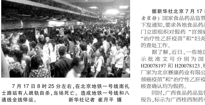
7月17日8时25分左右,在北京地铁一号线南礼士路站有人跳轨自杀,当场死亡。造成地铁一号线和八通线全线停运。