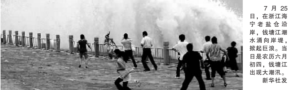
7月25日，在浙江海宁老盐仓沿岸，钱塘江潮水涌向岸堤，掀起巨浪。当日是农历六月初四，钱塘江出现大潮汛。