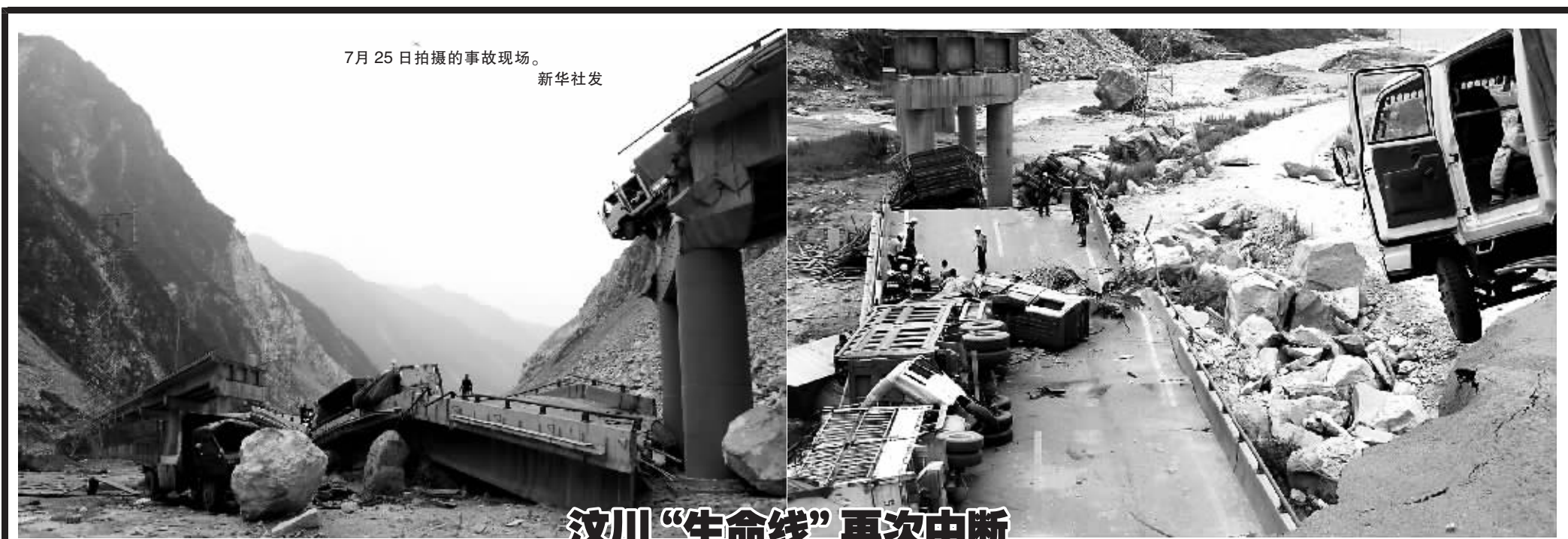
7月25日拍摄的事故现场。

根据《行政长官选举法》规定，澳门特区第三任行政长官由300名选举委员会委员以一人一票无记名投票的方式选出。选举管理委员会表示，虽然这次选举只有唯一候选人，但根据《行政长官选举法》的规定，候选人必须获得超过选委会全体委员半数的选票，即超过150票才可成功当选。