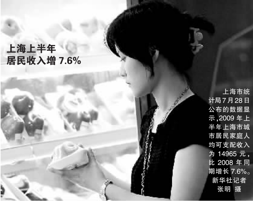
上海上半年 居民收入增 7.6%

上海市统计局 7 月 28 日公布的数据显示,2009 年上半年上海市城市居民家庭人均可支配收入为 14965 元,比 2008 年同期增长 7.6%。