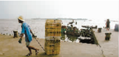
铺前跨海大桥建成后,铺前海产品销往海口将更加便利。