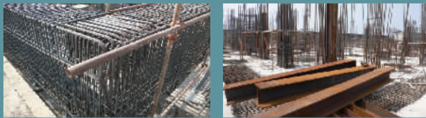
型钢在结构中的运用