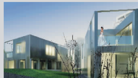
拥有6米高厨房的K别墅