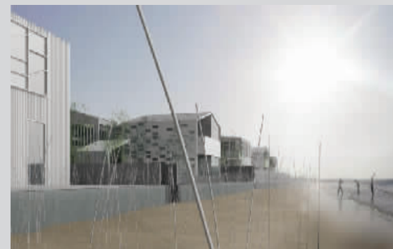
芦苇灯为天一方增添了几许梦幻