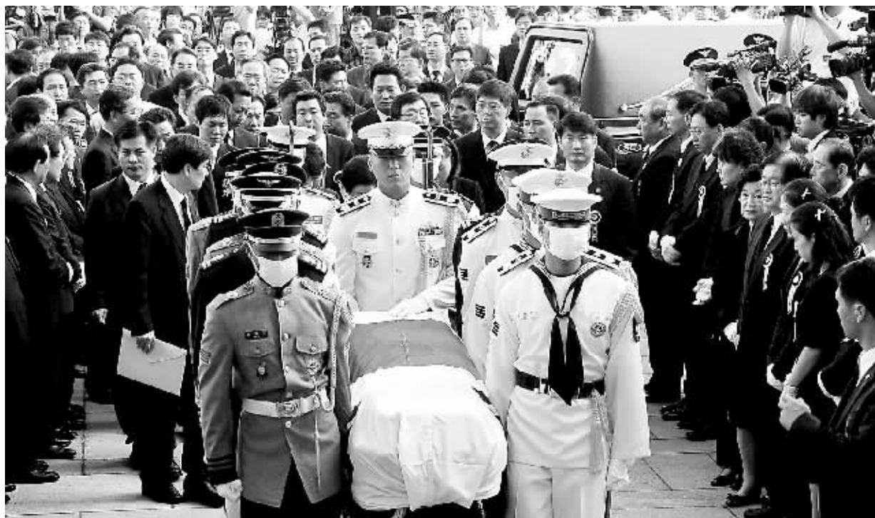
8月20日,韩国前总统金大中的灵柩在三军仪仗队的护送下从首尔塞弗伦斯医院运到设在国会会议室的正式灵堂接受吊唁。

夫人李姬镐女士将自传《同行》放到了金大中的怀里,书的扉页上是她作为最后礼物写给丈夫的一封信