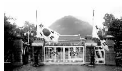
8月20日,在韩国首都首尔,韩国总统府青瓦台下半旗为已故前总统金大中致哀。

新华社首尔8月20日电 韩国前总统金大中的入殓仪式20日中午在首尔塞弗伦斯医院临时灵堂举行,灵柩随后被送往设在国会正门前的正式灵堂。