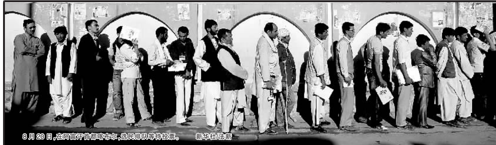
8月20日,在阿富汗首都喀布尔,选民排队等待投票。

在秘书处大楼游客大厅内举行的纪念仪式上,联合国秘书长潘基文向2003年8月19日在联合国格塔办事处爆炸事件中殉职的联合国工作人员致敬,并与在场的其他联合国官员一起默哀一分钟。