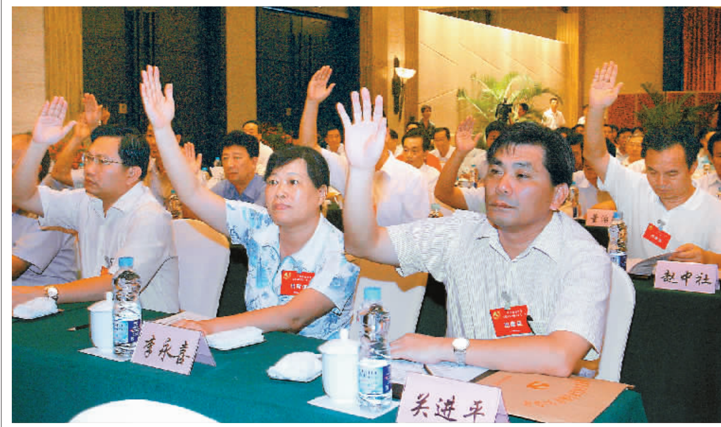
8月25日,中共海南省委五届五次全体(扩大)会议在万宁石梅湾召开。 这是与会同志举手表决,审议通过《中共海南省委关于实施新时期农村党的建设“强核心工程”的意见》和《中共海南省委员会全体会议任用重要干部投票表决办法(试行)》的情景。