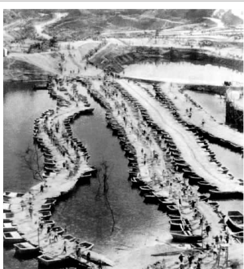
1958年,松涛大坝围堰工程施工现场,无数小船连成了四条浮桥,以方便跨江运土。

工厂赶制出了几百艘小木船,将这些船驶到江面上并起来,再在船面上铺上固定木板,搭成了浮桥。当年曹操在赤壁之战中使用过的“连环计”,再现于松涛水库的建设工地上。从此,土料通过这浮桥由建设者们挑进了工地。