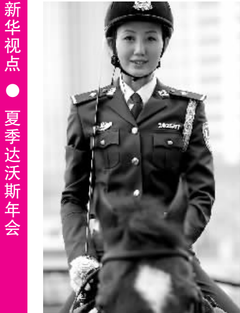
9月11日,英姿飒爽的大连女骑警在 2009 夏季达沃斯年会主会场世界博览广 场前列队礼仪执勤。

响和制约了我国新兴产业的跨越式发展。 对于发达国家基于雄厚资金和技术支撑的“低 碳经济”,中国面临节能减排及对传统能源技术进 行改造的重任。与国际上先进的能源技术相比,中 国能源转换效率普遍低 15%到 35%,重点企业单位 产品能耗平均比国际先进水平高 20%至 40%。 美国铝业公司总裁兼首席执行官克罗斯·克萊 因菲尔德认为,中国发展绿色经济的路径选择不必 盲从于领先的发达国家。“相对于发展低碳经济的 长远目标,改造现有产业、提高能源利用效率,或许 是当前中国最有效的绿色经济发展模式。”