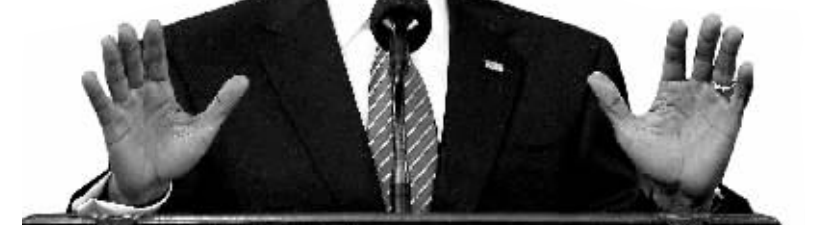
美国总统奥巴马近日在国会两院联席会议上阐述医疗政策改革计划,呼吁推动这项改革以拯救已陷入危机多年的美国医疗体系。