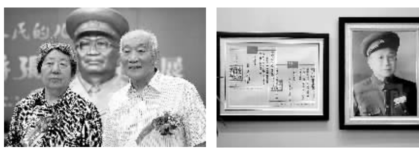
毛主席签署的张云逸出任广东省政府主席的任命状(左)。

“每次整理父亲的遗物,都是对父亲的一次再认识,仿佛更能读懂父亲的心。”张远之从北京核工业总公司退休后,大部分时间都在整理父亲生前的遗物。