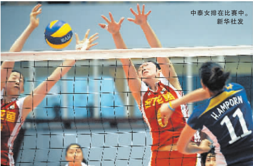
中泰女排在比赛中。

色的拦网，力擒卫冕冠军日本队，历史上首次闯入亚锦赛的决赛。虽然泰国队近两年上升势头明显，但是她们与中国队还存在一定的网上差距。本赛季双方两次交手，中国队均获得了胜利，此番第三次交锋，