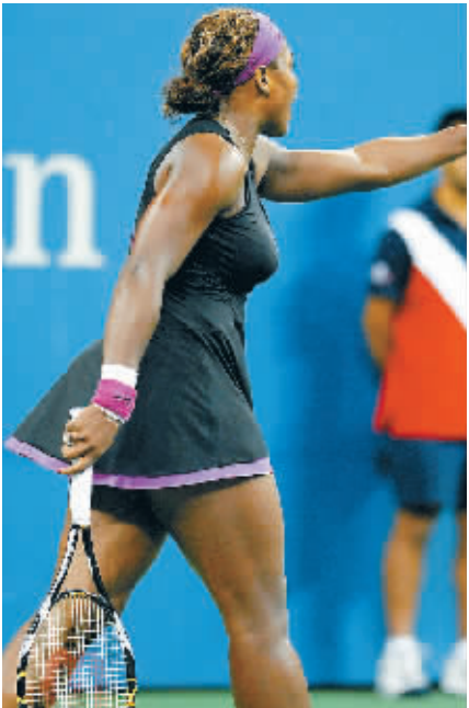
9 月 13 日，小威不满司线的判断，上前和司线理论。