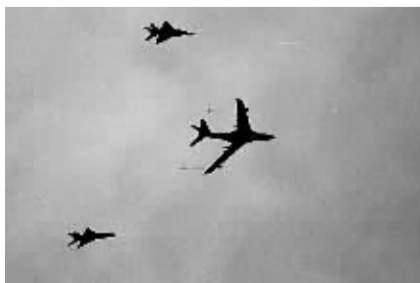
加受油机梯队首次参阅。

这次阅兵与15年前的国庆35周年阅兵相比,国防科技含量增大,高科技武器装备已开始成为主战武器,而且这些武器装备绝大部分为中国制造。