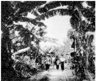
燕子潭里四时花果香。这是石屋人征服的第一座荒山。