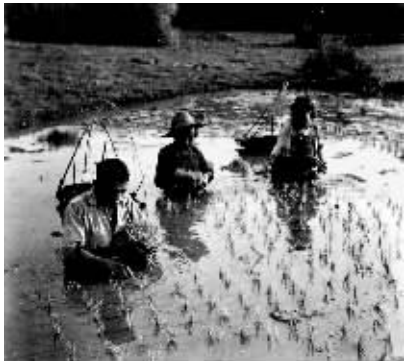
1969年，石屋大队社员在齐胸的沼泽地里插秧。

石屋，1960年代创造的富裕神话，一时风靡全国。周恩来总理一句“北有大寨，南有石屋”的评价，更是让石屋与大寨齐名，使“石屋精神”、“石屋模式”传诵至今。(本报海口9月23日讯)