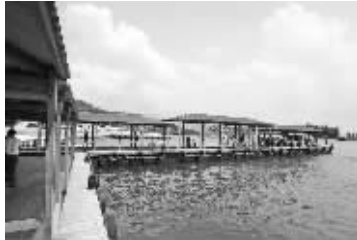
野生海洋世界一角