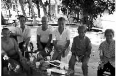
2009年9月8日，原石屋大队生产队员接受海南日报记者采访。