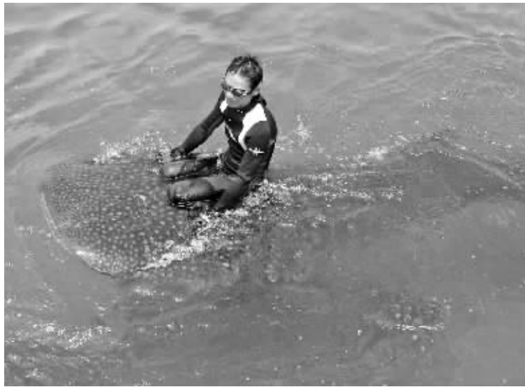
驯养师骑在大鲸鲨头上