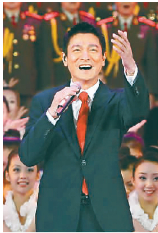
刘德华在水立方“迎国庆 庆中秋”晚会上演唱《中国人》。

基本绝迹。不过,今年是中国成立60周年,张学友自然是要出来庆贺的。刚刚在深圳拍完电影《全城热恋》的张学友在红磡体育馆举行的香港国庆晚会进行压轴演出,与“美声少女”杨沛宜合作,带领500位小朋友一起演唱根据温家宝总理的诗作《仰望星空》配乐而成的歌曲。