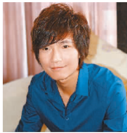
日前,陈楚生在海口接受媒体采访。

本报海口10月2日讯(记者原中倩)海南日报记者今日从长沙获得独家消息,已经于8月底结束仲裁终审的陈楚生与天娱的委托合同纠纷案再起波澜。天娱公司向长沙市中级人民法院提起诉讼,申请撤销仲裁终审裁决。长沙中院已经受理此案,并将于10月10日再次开庭审理。