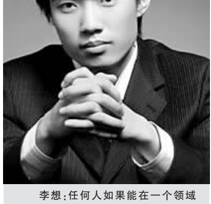
李想:任何人如果能在一个领域一直坚持10年,其实也都能做出一定的成绩来。(资料照片)

李想高中毕业后放弃读大学,醉心于互联网创业,从最初几千元的进账到一亿以上身价,用了不过短短4年。他的泡泡网也从最初的个人网站,发展为中国第三大中文IT专业网站。与众多携千万美元回