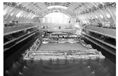
9月26日,考古工作人员正在发掘“南海一号”。

据悉,2008年10月20日,《南海惊梦——“南海一号”》已在杭州南宋官窑博物馆临时展厅作过正式展出。