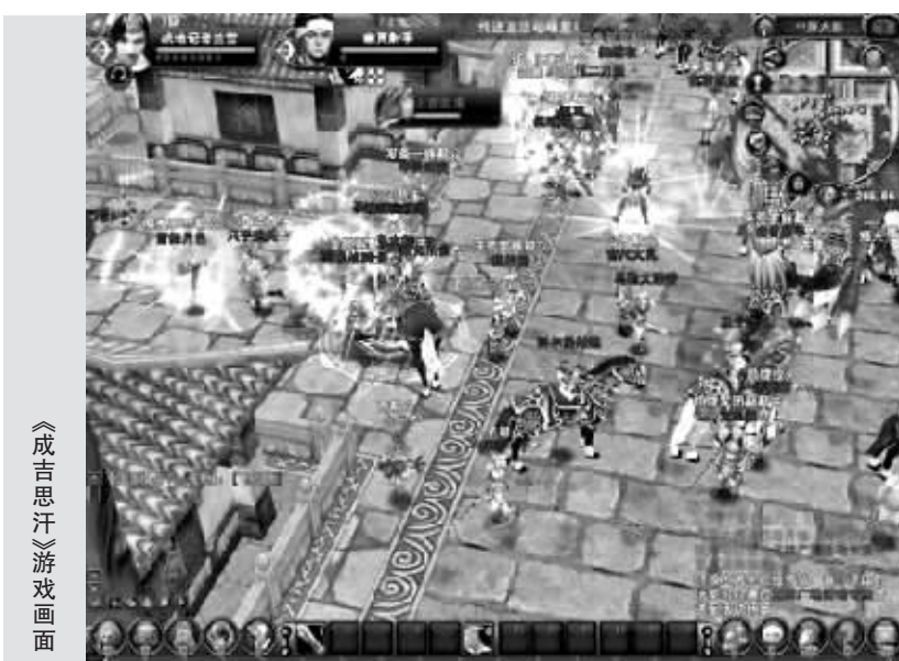
《成吉思汗》游戏画面

年来的国防和军队建设成果,是百姓最关心的国庆活动。在百度“魔兽争霸贴吧”中,署名“玉印山河”的网友上传了一个题为“魔兽争霸大阅兵!向国庆60周年献礼”的帖子。视频以管弦乐《东方红》开场,游戏中的牛头人、精灵、巨魔等排列好方