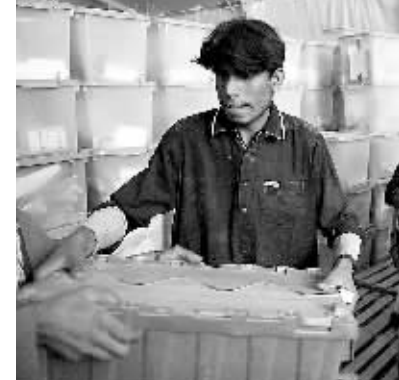
十月二十二日,工作人员在阿富汗首都喀布尔往卡车上装投票箱。