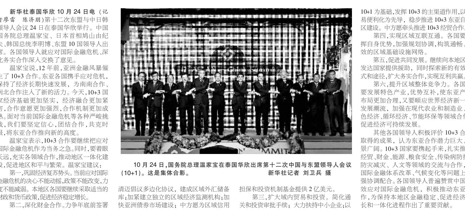
10月24日，国务院总理温家宝在泰国曼谷出席第十二次中国与东盟领导人会议(10+1)。这是集体合影。

温家宝说，12年来，亚洲金融危机催生了10+3合作。东亚各国携手应对危机，保持了经济长期快速发展，为南南合作、南北合作注入了新的活力。今天，10+3国家经济基础更加坚实，经济融合更加紧密，合作意愿更加强烈，合作机制更加成熟。面对当前国际金融危机等各种严峻挑战，我们要坚定信心，团结合作，共克时艰，将东亚合作推向新的高度。