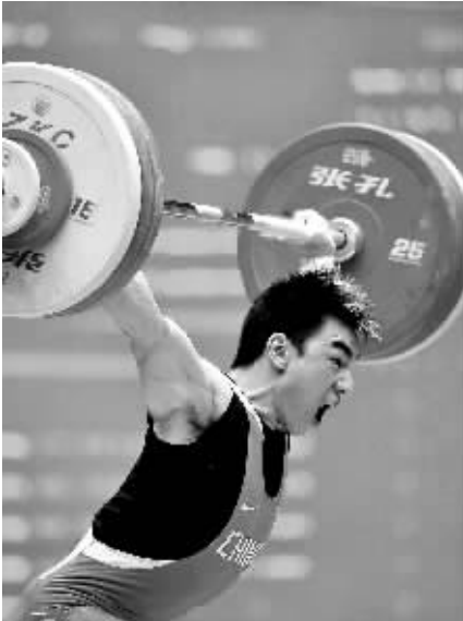
10月24日,在举重男子69公斤级比赛中,廖辉以358公斤的总成绩获得金牌,并超过该级别总成绩世界纪录。新华社发