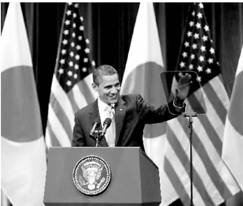
11月14日,到访的美国总统奥巴马在日本东京发表亚洲政策演讲。

而针对日本等盟国对中美接近的担心,奥巴马也作了安抚,称与中国深化关系不会削弱美国与盟国的关系。