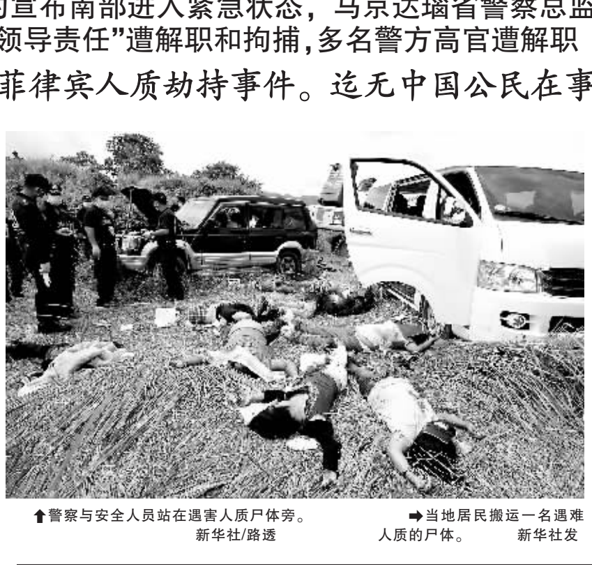
警察与安全人员在遇害人尸体旁。 当地居民搬运一名遇难人质的尸体。

据新华社马尼拉 11 月 24 日电 (记者谭卫兵 许林贵) 菲律宾军方 24 日说,菲律宾安全部队当天又发现 25 具前遭武装分子绑架的人的遗体,加上 23 日发现的 21 具遗体,从而使这次政治绑架和屠杀事件的遇害者人数上升到了 46 人。参与搜寻遇害者工作的菲律宾陆军第 46 步兵营营长罗多·内罗纳中校对媒体说,在当天夜里,一共发现 25 具遗体,他们大多是被近距离枪杀后集体掩埋。菲律宾武装部队发言人罗密欧·布罗纳中校 24 日下午说,在开展搜寻遇害者工作的同时,军方还派出直升机、坦克和大批军人追捕涉嫌参与这次政治绑架和屠杀事件的私人武装部队,但目前尚无任何有关行凶者被抓获的消息。菲律宾当天向事发地区增派军队。警方当天继续搜索遇难者尸体,死亡人数可能进一步上升。同一天,菲律宾总统格洛丽亚·马卡帕加尔·阿罗约强烈谴责这一事件,宣布南部棉兰老地区马京达瑙省、苏丹库达拉省和哥打巴托市进入紧急状态。阿罗约说,上述三地进入紧急状态,更方便警方捉拿凶手。紧急措施包括设立检查站,检查可疑人员等。马京达瑙省多名警方高官遭解职,接受警方调查。劫持案件发生后,有证人指