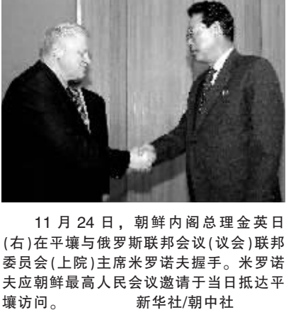
11 月 24 日,朝鲜内閣总理金英日(右)在平壤与俄罗斯联邦会议(议会)联邦委员会(上院)主席米罗诺夫握手。米罗诺夫应朝鲜最高人民会议邀请于当日抵达平壤访问。