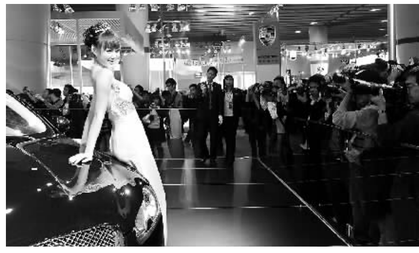
11 月 24 日,模特在广州车展上展示一款捷豹汽车。

本报讯 24 日正式向公众开放的第七届广州国际车展正处在 2009 年年尾,因此,本届广州车展被业内认为是明年国内车市的风向标。从厂家的参展力度上,从观众的关注热情上,从企业负责人对明年车市的政策预期和市场预判中,我们不难发现,2010 年的车市基调依然是稳步增长,暖风习习。明年车市会增长多少 记得 2008 年广州国际车展举办时,业内人士关注的一大悬念是市场还会不会增长,当时有著名调查机构甚至做出了 2009 年中国汽车市场零增长的判断。而今年广州车展上,大家关注的焦点变成了预测明年国内的市场增长率是多少。宝马集团大中华区总裁兼首席执行官史登科博士在广州对记者表示,如果中国相关车型购置税政策保持不变,预计明年国内车市至少会保持 10% 的增长。史登科博士说:“让我们回顾过去所有对中国汽车前景的预测,不管是 10 年前的预测,还是 1 年前国际金融危机显现时的预测,会发现现实都比预测要好。”他认为即使短期内有起伏,中国汽车市场长远还是有很大增长空间,长远看会成为亚洲最大的豪华车市场。上海通用汽车总经理丁磊对记者表示:对明年的汽车市场,我们认为不会有很大的变化,还会保持比较高的增长。下半年可能有一些现在不能确定的因素,但不会有大的变化,还是处于比较好的状态。总体来看,明年乘用车的增长大概是 20% 左右,上海通用的增长水平是不会低于行业的平均增长水平的。丁磊分析了为什么会为明年车市做出 20% 增长的判断,他认为今年车市约 40% 的增长可能是去年被推迟的消费在今年释放,今年的增长扣除这些因素,包括政策的影响,可能为 30% 左右。根据波峰波谷的情况来看,明年 20% 的增长应该问题不大。“据这个判断,上海通用的产品能够支持我们超过平均水平以上的增长。”此前,梅赛德斯-奔驰(中国)汽车销售有限公司总裁兼首席执行官瓦尔斯对记者表示,预计今年年底,奔驰在中国市场的整体销量将达到 6 万辆,年度同比增长超过 50%。预计在购置税因素保持不变的前提下,明年中国的整体汽车市场将有 10% 至 15% 的增长。水涨船高还是优胜劣汰 谈到对明年车市政策的建议,郁俊认为由于对海外汽车市场的出口仍然没有起色,